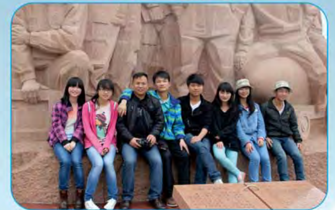
学生爱国传统教育