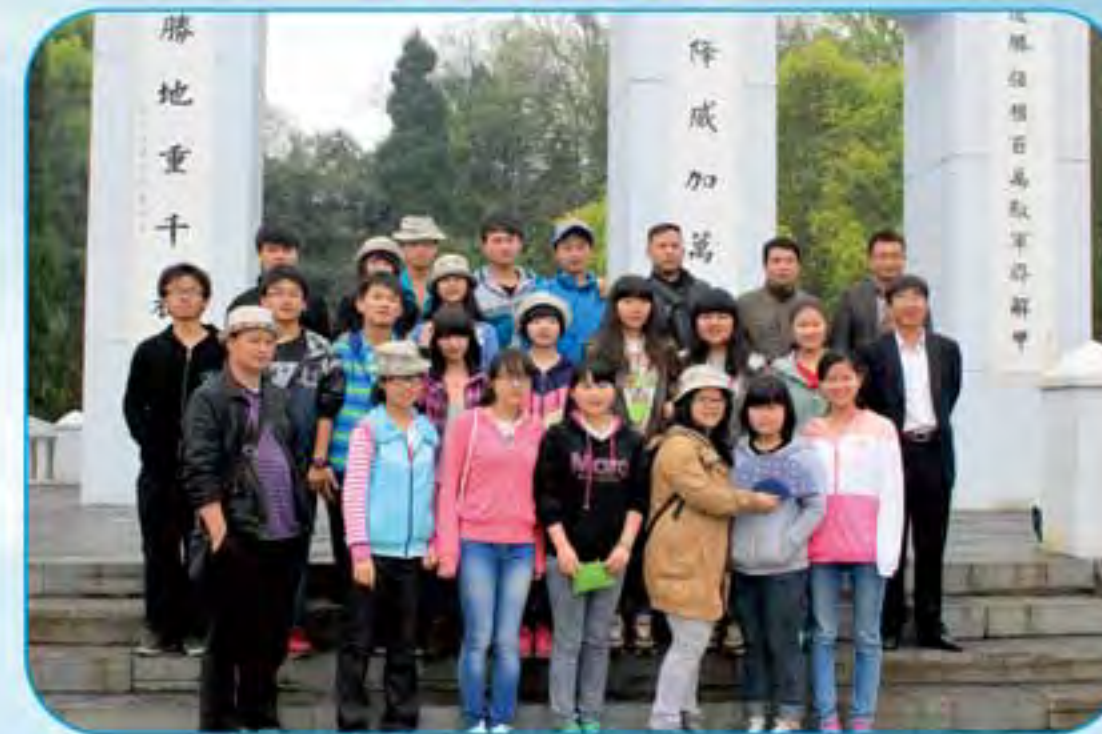
学生爱国传统教育