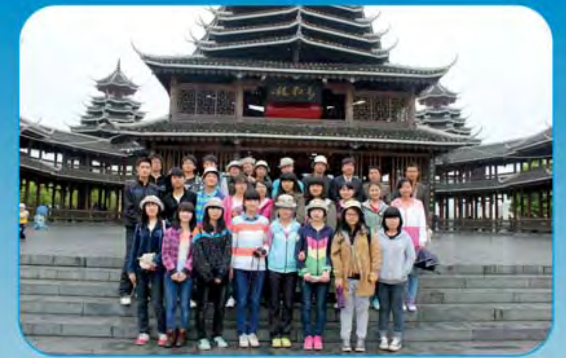
学生爱国传统教育